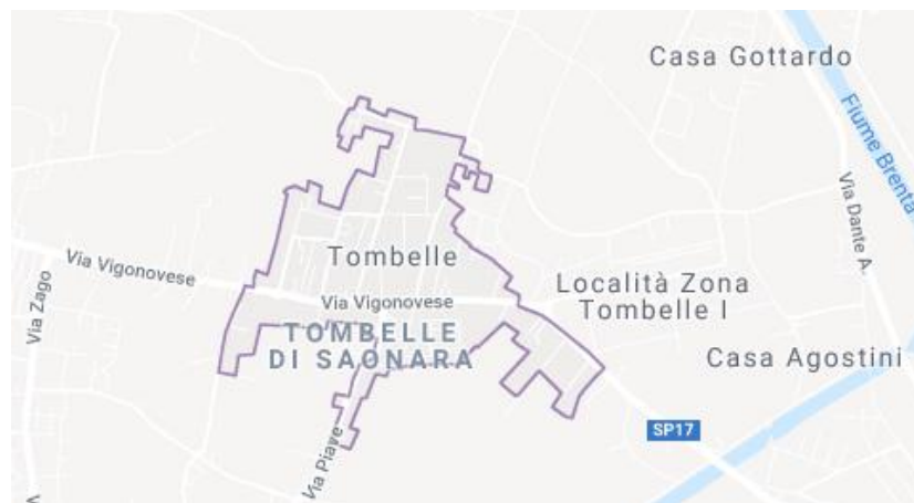
Figura 1 Confini Tombelle di Vigonovo

Tombelle ha la caratteristica di essere divisa in 3 zone con 3 diverse gestioni amministrative: Saonara, Padova, Vigonovo. Nello specifico il Micronido “ S. Cuore ” è sotto la gestione del Comune di Vigonovo.